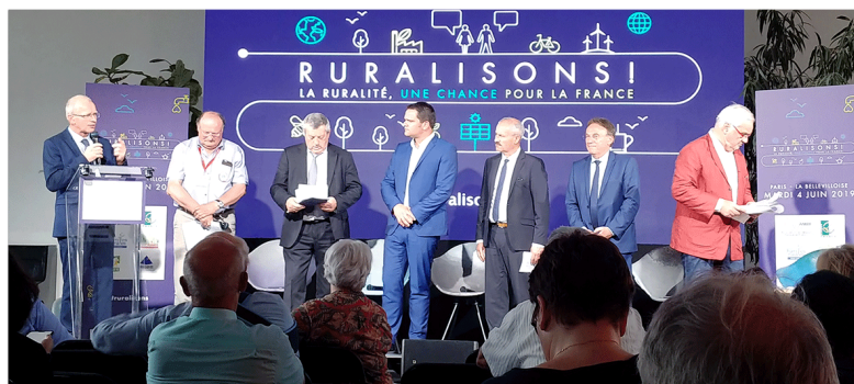
Les présidents des six structures organisatrices (A.M.R.F., A.N.N.R., Familles rurales, Leader France, M.F.R., UMIH), lors de l'événement Ruralisons ! en juin 2019.

Pour consulter le programme complet ou vous inscrire, cliquez ici.