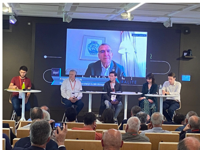
Francisco BOYA, secrétaire d'État espagnol chargé du défi démographique, et Egidijus GIEDRAITIS, vice-ministre de l'agriculture de Lituanie, lors de la table-ronde consacrée à la jeunesse

Ces acteurs ont souvent du talent comme en ont témoigné les élèves de cinq maisons familiales rurales (M.F.R.) chargés du service et de la réalisation des repas. Savoureux moment de convivialité pour promouvoir l'appétit d'Europe !