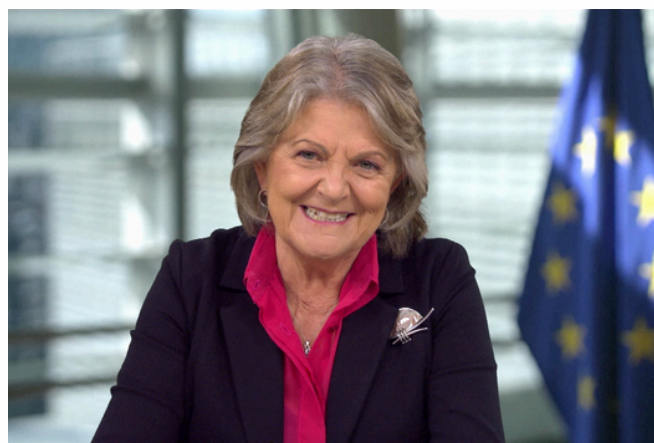
Élisa Ferreira, commissaire européen à la cohésion et aux réformes, lors de son intervention en clôture des échanges.

Retrouver l'intégralité des échanges ici