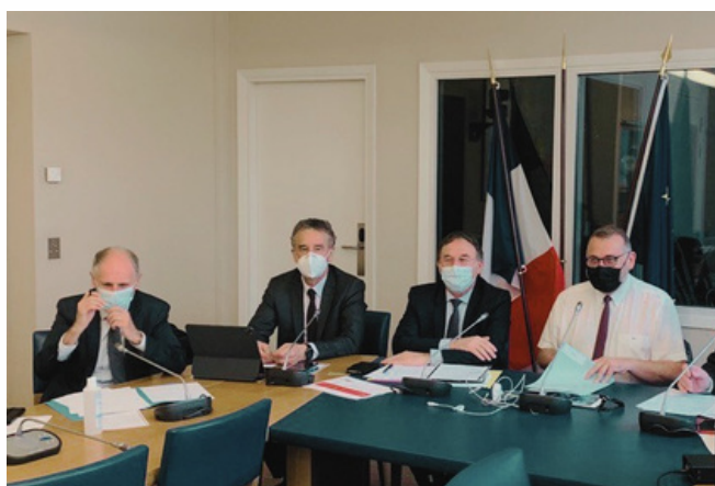
Les membres du bureau de l'A.N.N.R. aux côtés de Joël Giraud, secrétaire d'État chargé des ruralités.

Retrouver l'intégralité des échanges ici